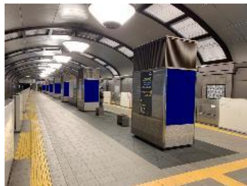
心齋橋ホームビジョン