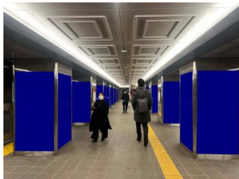
心齋橋ホームシート