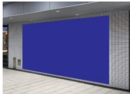
心齋橋グランシートA