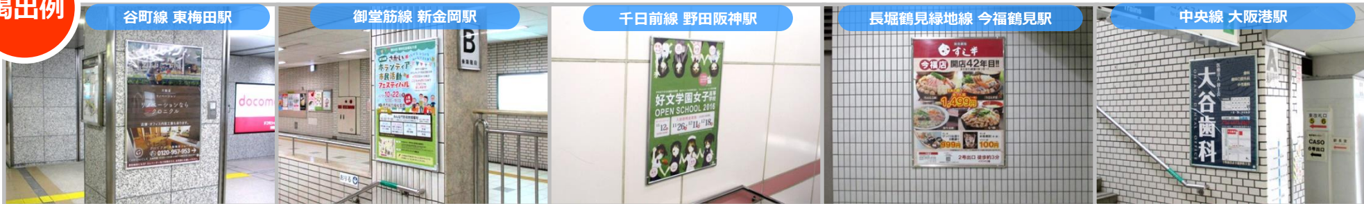
■ ショールームの案内として使用

ご希望の駅構内の壁や柱などに B1 または B0 ポスターを 1枚1週間 からご掲出頂けます。