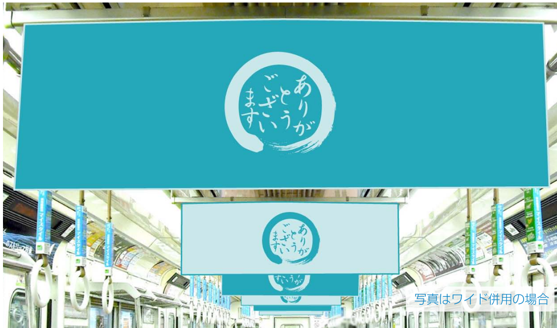
写真はワイド併用の場合

大阪地下鉄のメイン路線・御堂筋線の一編成全部の中吊、窓額にB3ポスターを掲出できます。 ※一部を除く