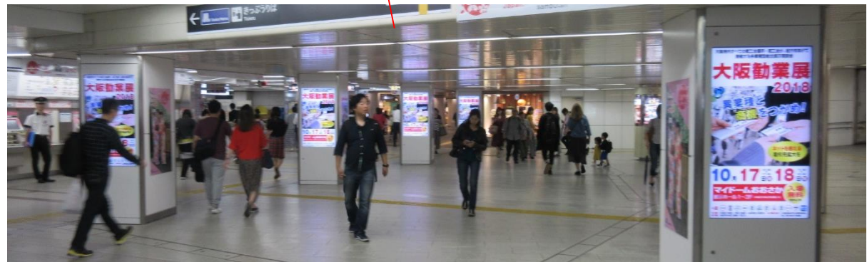
※写真は設置イメージです。